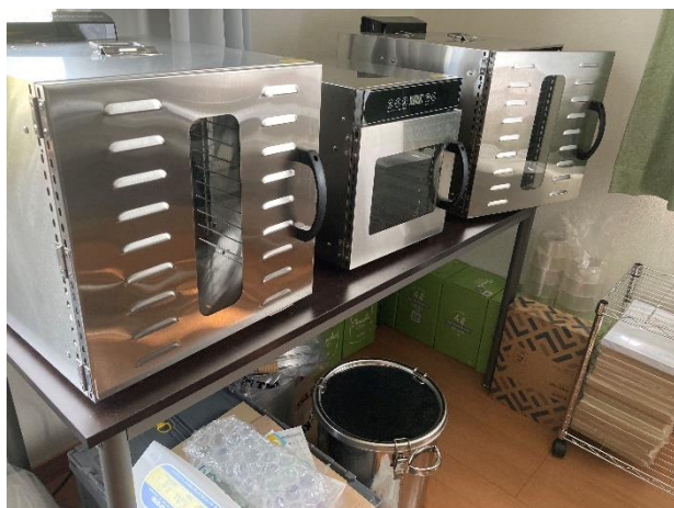
【左の写真】 乾燥させるための

安価で大量生産を目指すのではなく、無添加でおいしく安心して食べられるペットフードの製作にこだわっているため、販売については自己管理できるように、ネットショップでのみでの販売となっています。