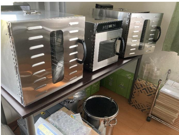
【左の写真】 乾燥させるための

安価で大量生産を目指すのではなく、無添加でおいしく安心して食べられるペットフードの製作にこだわっているため、販売については自己管理できるように、ネットショップでのみでの販売となっています。